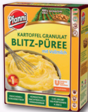
L-Art.Nr. 2122 Kartoffel-Granulat Blitz-Püree, mit Vollmilch 5 kg Kt.