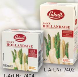
L-Art.Nr. 7404 L-Art.Nr. 7402 Sauce Hollandaise Nr. 1 250 ml Pg./1l Pg.