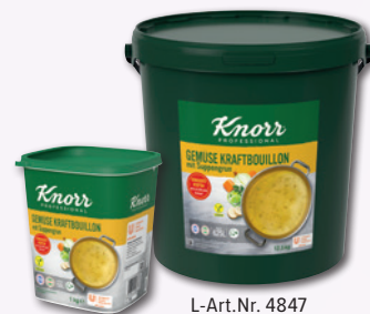
L-Art.Nr. 468 L-Art.Nr. 4847 Professional Gemüse Kraftbouillon mit Suppengrün 1 kg Pg./12,5 kg Ei.