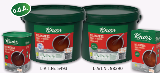
L-Art.Nr. 681 L-Art.Nr. 5493 L-Art.Nr. 98390 L-Art.Nr. 682 Delikatess Sauce zu Braten 1 kg Pg./10 kg Ei./10 kg Ei./3 kg Pg.