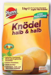
L-Art.Nr. 2112 Knödel halb & halb 5 kg Bt.