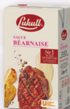
L-Art.Nr. 7406 Sauce Béarnaise 1l Pg.