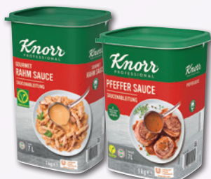
L-Art.Nr. 592 L-Art.Nr. 595 Professional Saucen je 1 kg Pg. • 592 Gourmet Rahm Sauce • 595 Pfeffer Sauce