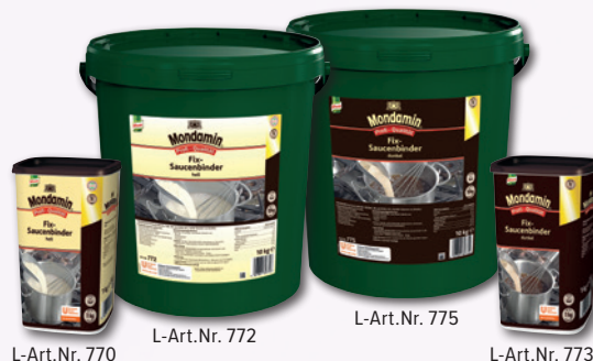
L-Art.Nr. 770 L-Art.Nr. 772 L-Art.Nr. 775 L-Art.Nr. 773 Mondamin Fix Saucenbinder, hell oder dunkel 1 kg Pg./10 kg Ei.