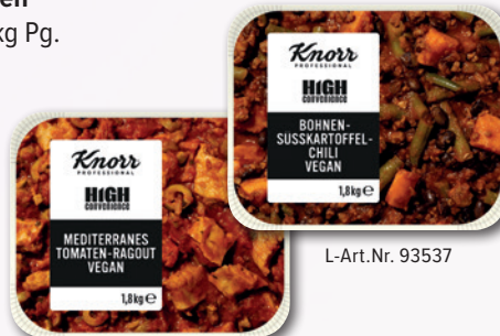
L-Art.Nr. 91969 L-Art.Nr. 93537 Professional High Convenience je 1,8 kg Pg. • 91969 Mediterranes Tomaten-Ragout • 93537 Bohnen Süßkartoffel Chili